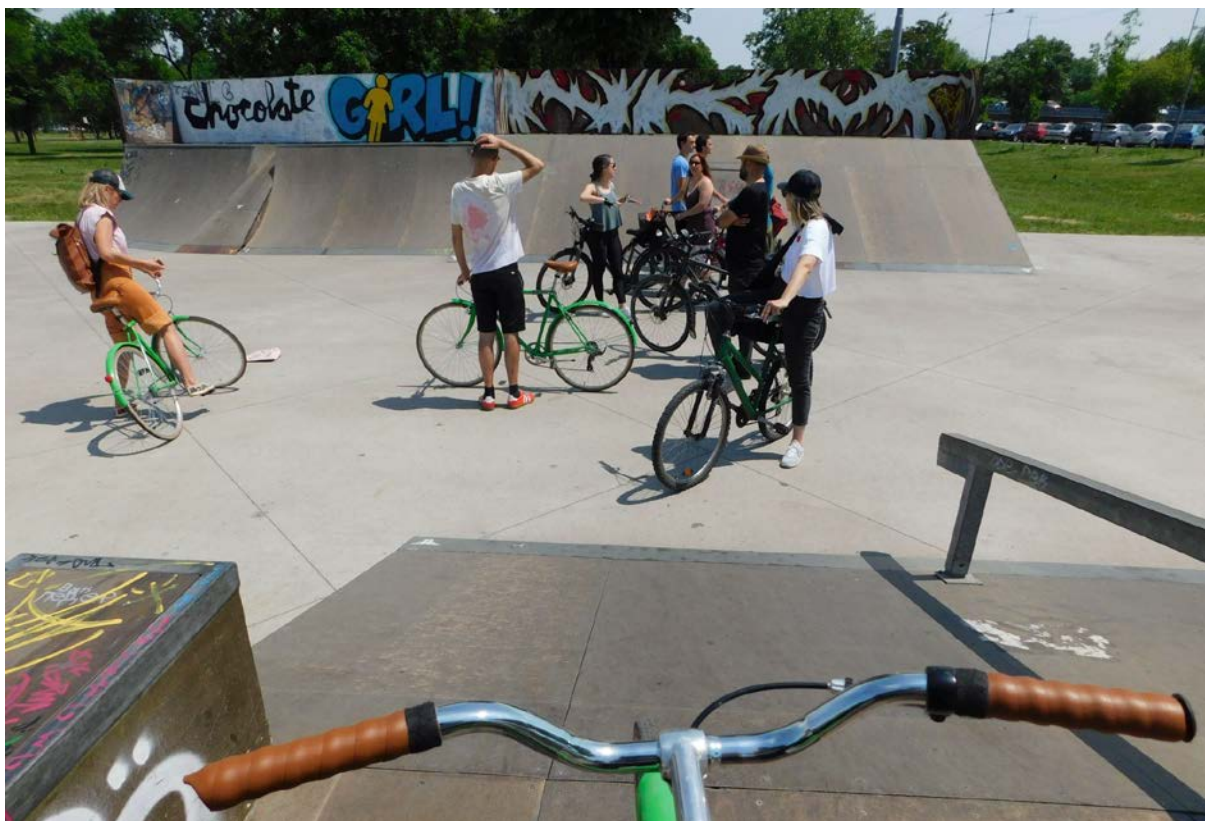
Kolesarski študijski izlet partnerjev Zahodnega Balkana ob podpori Društva Ulice za kolesarje – v iskanju in proučevanju igrišč Beograda.

V preteklih desetletjih smo priča vse večji urbanizaciji mest v regiji, kjer imajo avtomobili in zgoščanje pozidave prednost pred naložbami v povečanje in izboljšanje kakovostnih javnih površin v skladu s potrebami lokalnih skupnosti ter krepitvijo zelene infrastrukture, ki bi mesta naredila bolj odporna na podnebne spremembe in pripomogla k zdravemu okolju za razvoj otrok in odraslih. Partnerske organizacije želimo s tem projektom opozoriti na to problematiko, ki zadeva vse plati družbe in družbenega razvoja, to dejstvo pa močno vpliva na prostore igre, ki so ustvarjeni za sedanje in prihodnje generacije.