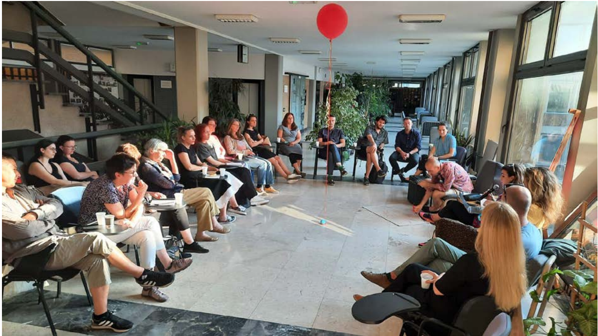
Javni pogovor "Igra se začne, ko se pojavimo!" je potekal v okviru programa Pogovori med Oddelkom za pedagogiko in andragogiko Filozofske fakultete v Beogradu.

Ta pristop krepi vlogo otrok in mladostnikov, spodbuja njihovo domišljijo in samostojnost pri delu in življenju. Opolnomoči jih pri uveljavljanju pravice do javnih površin in, kar je še pomembneje, do varne in pristne igre.